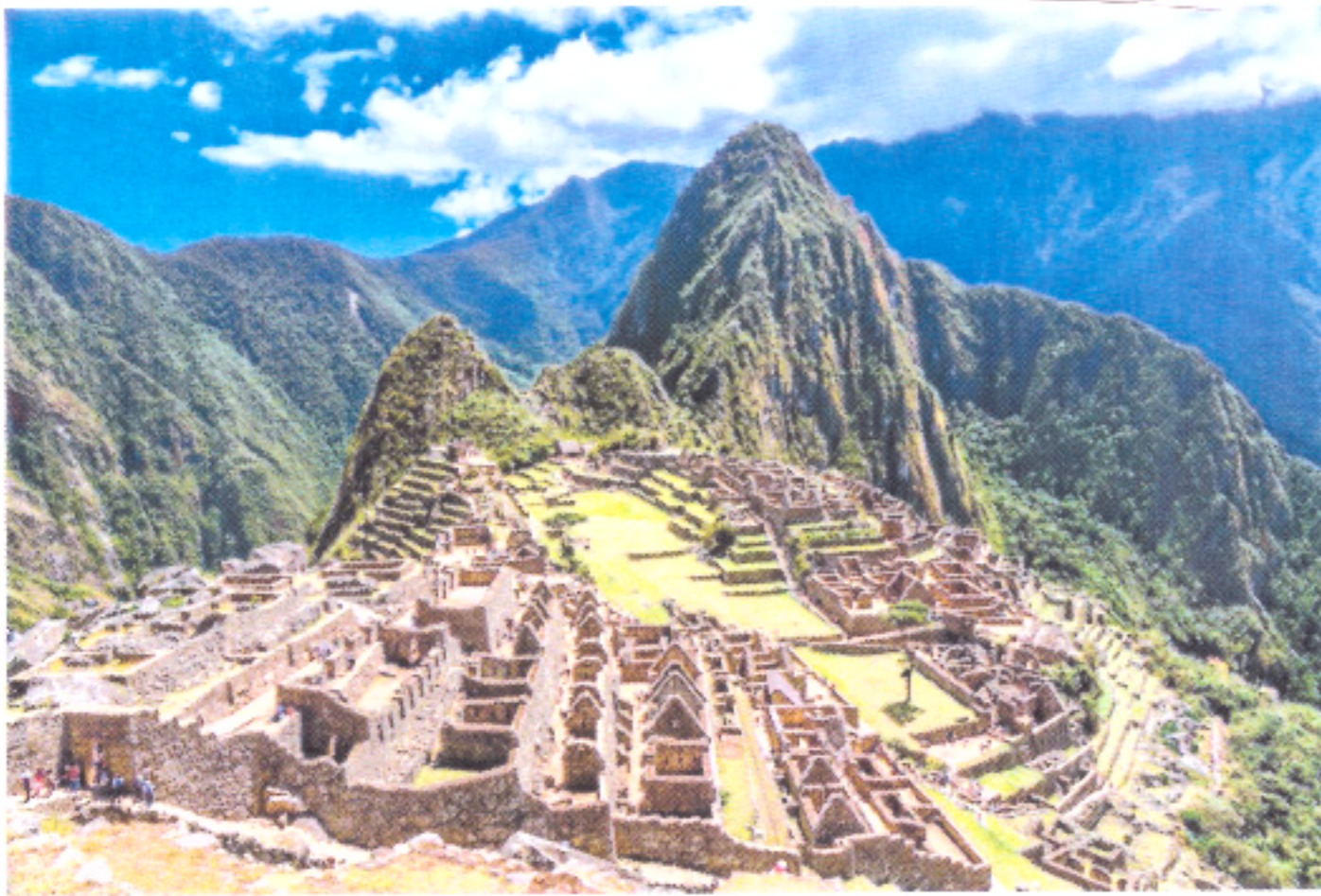
Inkas und Peru