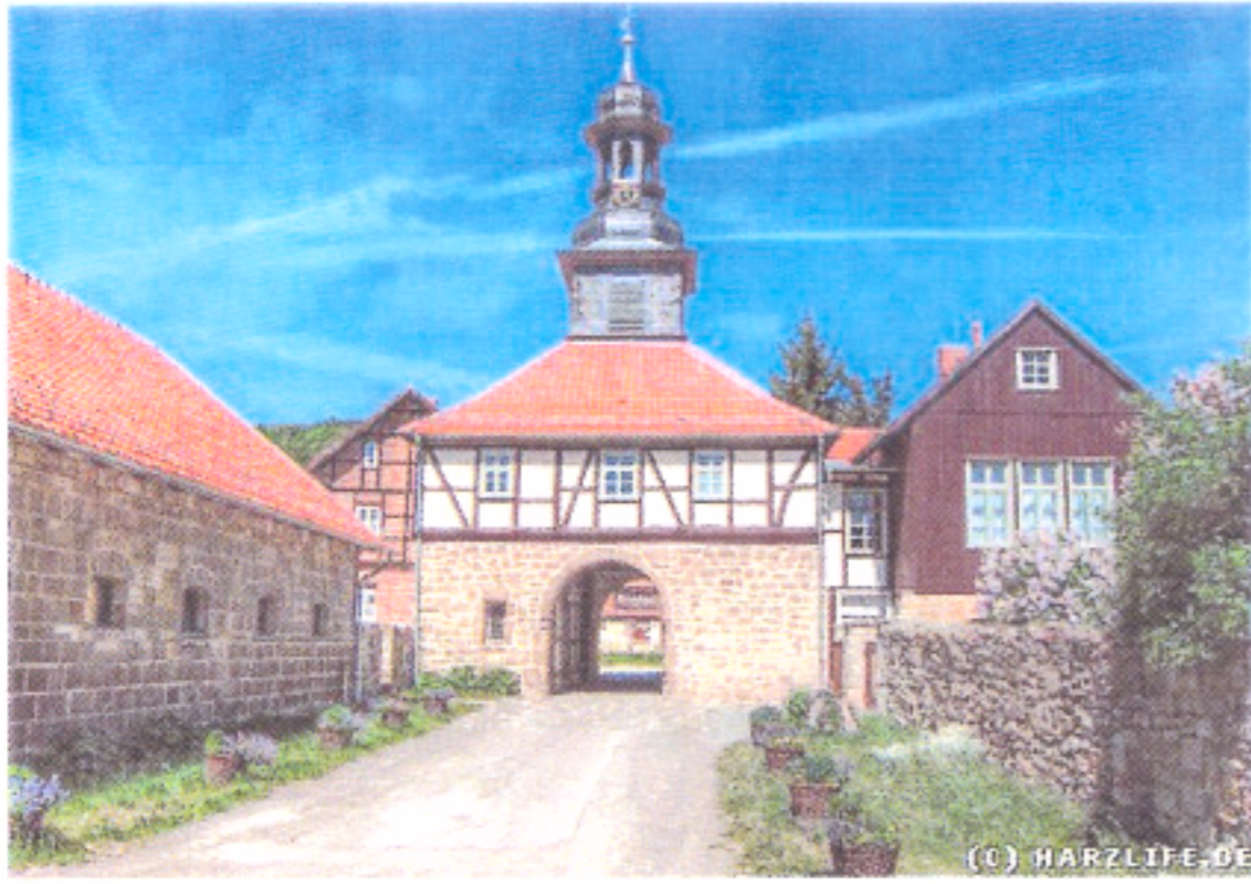
Kloster Michaelstein Blankenburg

Achtung: Klassenstufe 5 und 6 – Finde die Lösung.