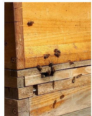
GAT Bienen (April, 2023)